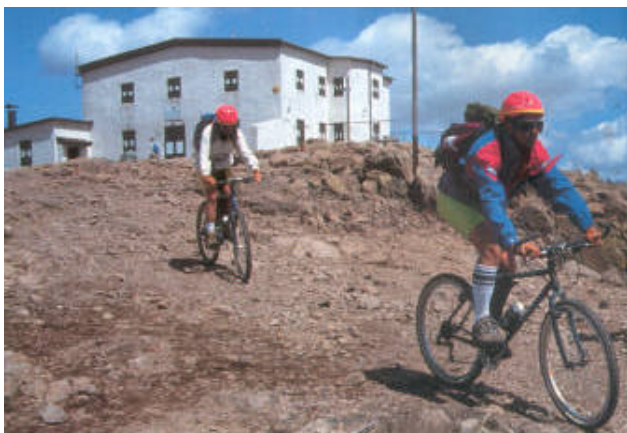
Orizzonti senza fine dalla vetta del Corno di Renon