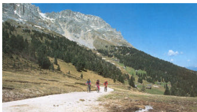
La breve salita sotto il Latemar, al passo di Pampeago

Dagli Occlini la discesa (e quindi il rientro) a Bolzano è letteralmente grandiosa. Seguendo i segnavia n.1/9 arriviamo per una via tutta nuova a Pietralba e, sempre per il tracciato n. 1, giù giù tutto di un fiato, emozionante alle stelle, giù fino a Laives per poi tranquillamente rientrare a Bolzano.