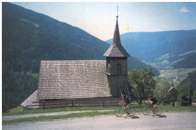
Caratteristica chiesetta in Val Sarentino

Un'altra funivia! La terza, che dalla città ci sbalza silenziosamente verso il cielo. Il Colle oscurato dalla vastità e la notorietà degli altipiani di S.Genesio e del Renon, ad un solo passo da Bolzano è un paradiso dimenticato, tutto da riscoprire, da vivere, gioire e pedalare.