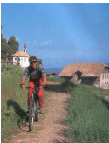
Dal Colle dei Signori, sopra Bolzano, verso Nuova Ponente per le veloci strade forestali

Aprile, in alto le dime del Catinaccio svettano nel cielo azzurro ammantate di bianco dove l'inverno regna ancora sovrano. Da Bolzano, la "porta delle Dolomiti", è esplosa la primavera. Pedalando lentamente andremo alla scoperta dei colori più belli e dei profumi più delicati.