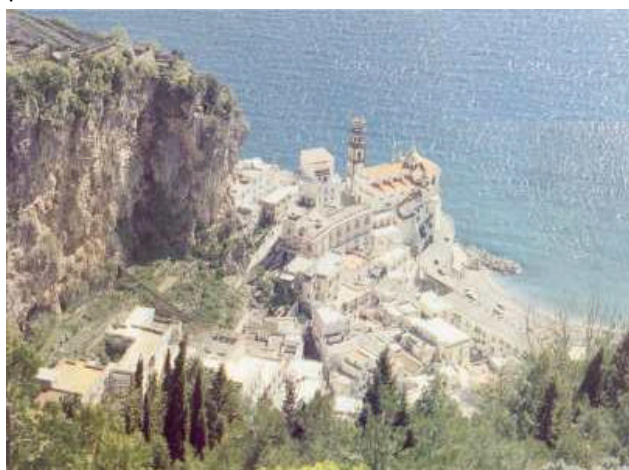
Panorama aereo del Borgo di Atrani dal Belvedere nei pressi della pineta del Castello, punto culminante della prima tappa

Per il pernottamento, è possibile montare una tenda proprio nei pressi della fontana. Mentre invece, per chi cerca un morbido letto, basta ritornare indietro al bivio di Fontone (10 min.) e da qui, proseguire in discesa, lungo il sentiero che parte da Scala, attraversando case, campi, una rupe di roccia calcarea e vecchie mura che testimoniano un passato ormai dimenticato, giù per quell'infinita serie di gradini, rampe e scale, in parte sistemate ed in parte scavate nella viva roccia che portano (20, 30 min. circa) tra le case del borgo di Chiorito, alla periferia nord di Amalfi. Ad Amalfi è possibile pernottare (preferibilmente prenotandosi prima) tra quelle decine di alberghi, pensioni ed ostelli che per la loro accoglienza, sono il vanto del richiamo turistico per questa incantevole città marinara.