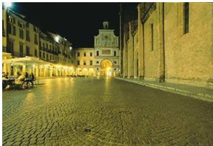
Seconda tappa della ciclabile del Canale Vacchelli