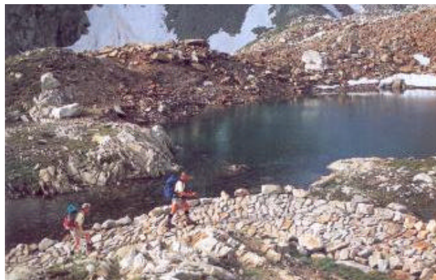
Il bacino artificiale di Chiotas ai piedi del massiccio dell'Argentera

Il rifugio Questa della sezione Ligure del CAI (tel.017197338) è aperto da metà giugno a metà settembre; e dispone di 45 posti letto.