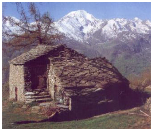
Una vecchia isolata casa di Chiapili

Si scende per la via di salita in circa 45 minuti.