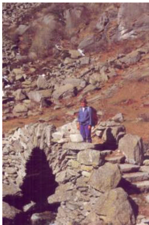
Il rustico abitato dall'Alpe del Cres

Dalla piccola piazzetta dove termina la stradina salire a sinistra, agli alpeggi superiori, e poco prima di raggiungerli andare a destra iniziando a seguire una mulattiera (in diversi punti ostruita dalla vegetazione) che porta a superare un rio che scorre un valloncetto per poi giungere alle prime case del borgo di Missirolo (1452m; ore 1,45). Si ridiscende in un'ora per la via di salita.