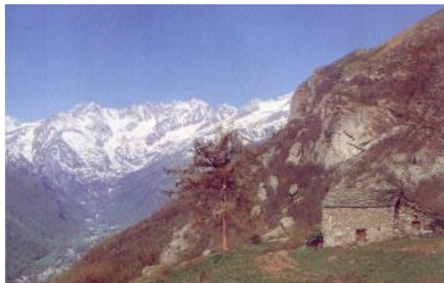
Colori primaverili in Val Grande di Lanzo, nei pressi di Chiapili

Infine resta da ricordare l'eroico periodo della Lotta Partigiana (settembre 1943 > aprile 1945) che vide la valle teatro di furiosi e famosi scontri. Per un breve periodo (estate 1944) la Val Grande fu completamente liberata dai nazi-fascisti. Dopo la fine della guerra l'emigrazione aumentò ulteriormente, la tipica attività agro-pastorale divenne da primaria a complemento di altre fonti di reddito ed il turismo da residenziale, nel periodo estivo divenne occasionale con poche puntate "mordi e fuggi" nel fine settimana.