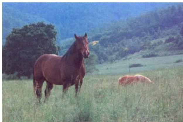
Esemplari di cavalli semiliberi al pascolo