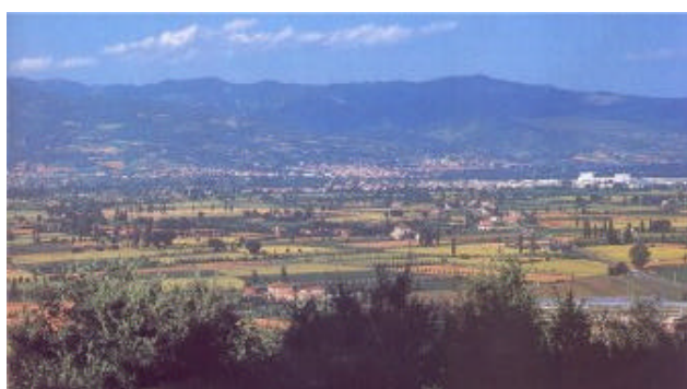
La Valtiberina toscana da Anghiari; sullo sfondo la catena dell'Alpe della Luna

E' da sempre il centro più importante della Valtiberina Toscana. Le origini sono avvolte ancora nel mistero, anche se possiamo ricondurle all'arrivo di due pellegrini di ritorno dalla Terra Santa che in questo luogo costruirono una cappella per le reliquie del Santo Sepolcro. La posizione marginale del territorio, ha permesso al Borgo Santo Sepolcro di mantenere attraverso i secoli il suo stato di libero comune fino a che non passò definitivamente, nel 1440, ai Medici. Nonostante il depauperamento architettonico dovuto a ripetuti terremoti, Sansepolcro conserva ancora l'assetto urbanistico medievale dentro la cinta muraria, arricchito da palazzi rinascimentali e dalla fortezza medicea di Giuliano da Sangallo. Città natale di Piero della Francesca conserva alcune tra le opere magne del grande artista, prime fra tutte la Resurrezione e il polittico della Madonna della Misericordia. Edifici di interesse storico e architettonico: la Cattedrale, S.Francesco, il Palazzo delle Laudi, Palazzo Ducci - Del Rosso, Palazzo Graziani, Oratorio della Madonna delle Grazie. Noto l'artigianato orafa, ceramiche e merletti.