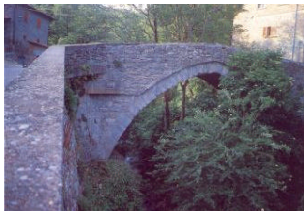
L'antico ponte medievale di Ponte alla Piera, sul tracciato del collegamento romano della via Armenensis

N.B. - Varianti a questi percorsi prevedono un approfondimento delle zone centrali all'ampio cerchio disegnato dalle tre tappe, in particolare la Valsavignone.