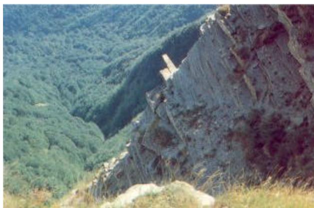
La Ripa della Luna

Nel comprensorio sono stati segnalati ben 10 percorsi con alcune varianti che abbracciano ogni angolo più nascosto. Essi si sviluppano in tre territori ben diversi per le caratteristiche geografiche e culturali: la valle superiore del Tevere toscano, la Marca toscana, la valle inferiore del Tevere toscano. Si passa da zone di vera e propria montagna alla pianura del Tevere completamente organizzata con moderne pianificazioni di produzione agricola. Per ogni settore proporremo ai lettori della Rivista un itinerario, rimandando per gli altri al volume di Scipio Covan "Dove nasce il Tevere", Guide Verdi, ed. Maggioli, Rimini, pubblicato col patrocinio della comunità montana Valtiberina Toscana.