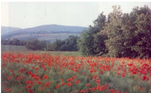
Papaveri tra il grano sui coltivi dell'Alpe Catenaria

Premio Internazionale di Cultura "Voluseno" - Premio di giornalismo "L'Appennino". Per informazioni: tel. 0575/772642.