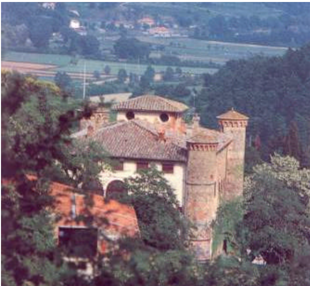
Il castello di Galbino, in Val Sovara, perfettamente conservato

In compenso il confine storico equivale a quello geografico a est con le Marche con il proseguimento del massiccio dell'Alpe della Luna; a ovest l'Alpe di Catenaia e l'Alpe di Poit dividono rispettivamente dal Casentino e dall'Aretino.