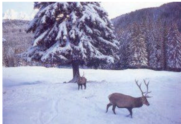
I cervi del recinto faunistico Paneveggio. Sono più di 700 gli esemplari in libertà nei boschi

e infine alla Provincia Autonoma di Trento. Gli abeti rossi costituiscono quasi il 90% degli alberi della foresta, associati all'abete bianco alle quote inferiori, al larice e al pino cembro a quelle superiori. Il sottobosco è costituito da un tappeto di mirtillo nero e rosso.