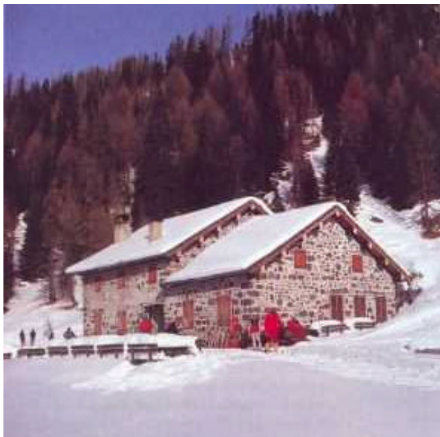
La malga Venegiotta, sosta d'obbligo durante la risalita della Val Venegia.

Descrizione: si rimonta la strada che più volte interseca le piste di discesa a fianco della sciovia che sale alla capanna Cervino. Qui prende quota con ampi tornanti tagliando più volte le piste sul versante occidentale della Costazza e si giunge alla baita Segantini nei pressi del passo che si apre fra la Costazza e le Punte Rolle. Al rifugio si può giungere direttamente anche con una seggiovia che parte dal versante della Val Cison del passo Rolle, ma la risalita con gli sci permette di scaldarsi in fondo solo di poco più di 200 metri di dislivello che si coprono comodamente in un'ora di ascesa. Oltre il passo ci si affaccia sul profondo solco della Val Venegia che si allunga ai nostri piedi prima verso nord, poi in direzione nord/ovest così da aggirare completamente le cime della Costazza e del Castellazzo.