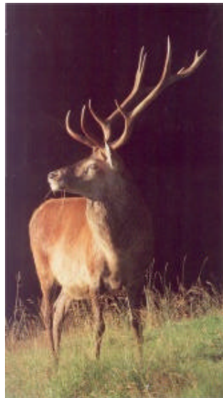
Un maestoso esemplare di cervo esce dal buio del bosco per scaldarsi al sole in una radura