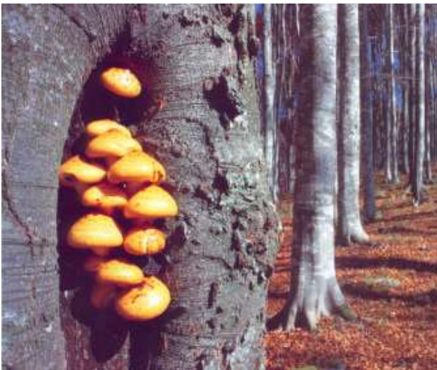
Funghi in una faggeta, uno dei tanti spettacoli che la natura è in grado di offrirci

Sempre seguendo il sentiero n.703 si oltrepassa il rio (614m) e si raggiunge la stradina forestale. Da qui, svoltando a sinistra è sufficiente seguirla fino a Borgo Lischiazze (525m); da forcella La Forchia a Borgo Lischiazze si impiega circa un'ora. Al primo bivio si imbocca la stradina di sinistra, verso Case Gost e da qui si segue per 30 minuti il sentiero CAI n.707 fino al ponte dal quale abbiamo iniziato il nostro itinerario.