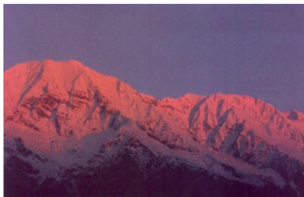
Tramonto sul Monte Canin 2587m

La discesa verso S. Anna di Carnizza non presenta particolari difficoltà se effettuata nei periodi in cui la neve è completamente assente; in caso contrario è necessaria attrezzatura adatta come ramponi e racchette da neve. Dalla Bocchetta di Zaiavor infatti il sentiero, per certi tratti ripido, prosegue lungo il versante nord ed effettua alcuni ampi tornanti tanto da scendere di quota in breve tempo. La parte più alta attraversa saliceti, seguiti da macereti. Sono dunque solo i primi 20 minuti di discesa che richiedono un minimo di attenzione. Da qui in poi tutto si fa meno impervio e più dolce e nuovamente si ritrovano le ampie e fresche faggete. Si raggiunge ed oltrepassa un ghiaione ed in poco meno di