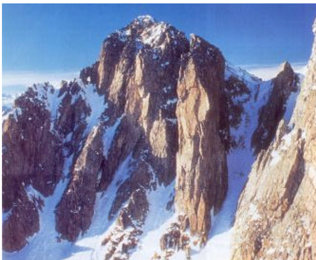
Le imponenti strutture rocciose di Cima d'Asta

A cavallo tra Veneto e Trentino, sospeso a 900 metri sulla sinistra orografica della Valsugana, l'altopiano del Tesino pare un'isola circondata da rilievi montuosi. E come un'isola ha saputo conservare nel tempo tradizioni che si perdono nelle antiche memorie dei primi viaggiatori. Questi luoghi sono conosciuti fin dai primi anni dell'Impero Romano, perché tra questi boschi passava la Via Claudia Augusta Altinate, importante collegamento tra la laguna veneta e le regioni danubiane. In epoca più recente è stato teatro, insieme alle confinanti zone dell'altopiano di Asiago, di lunghi anni di combattimenti, durante la Prima Guerra Mondiale. Di quei tragici eventi rimangono, come