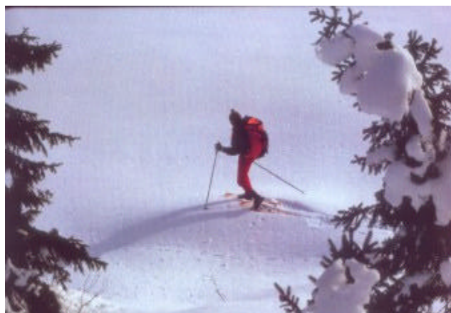
Un suggestivo scorcio dell'Altopiano del Tesino

Dal campeggio, verso sinistra sale la strada che porta a Malga Sorgazza (1450m - ore 1.30), dove   possibile arrivare in auto. Da qui ci si incammina verso Malga Cima d'Asta (1588m) poi si affronta la ripida salita verso Forcella Magna (2117m) dominata dal massiccio di Cima d'Asta.