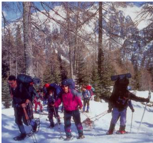
Un momento dell'escursione durante il winter trekking

Immaginate un paradiso per i trekker ... altipiani sospesi nel cielo aperto, aggrappati a pareti di roccia brunita. Prati e boschi dimora della linca, dell'aquila, del cervo. Piccole valli dove la Natura è ancora padrona incontrastata. Paesaggi e panorami che ricordano scorci dell'Alaska, del klondike, del Grande Nord ... è il Tesino. Castello, Pieve, Cinte, paesi ricchi di storia, gente dalla marcata identità culturale, gelosa delle proprie tradizioni.