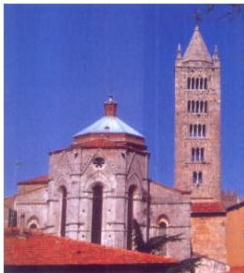
Massa Metallorum, banditrice del primo codice minerario

figure coinvolte: il proprietario terriero, i partiarri che affrontano le spese per rendere il sottosuolo fonte di ricchezza, i magistri depositari dell'arte di estrazione e i semplici laborantes. Tramonta così il principio secondo il quale il proprietario delle terre ne era padrone fino al cielo (usque ad coelum) e fino agli inferi (usque ad infera).