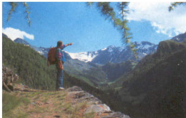
Panorama sul vallone di Mont st. Marcel dal deposito minerario di Servette

Scopriremo le bellezze del versante sulla destra orografica del fiume Dora Baltea, cercando così di conoscere più a fondo la straordinaria bellezza e varietà della flora e della fauna del Mont Emilius.