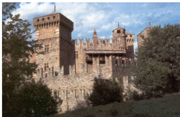
Uno scorcio del bellissimo castello di Fenis (nei documenti storici appare per la prima volta il 19 Dicembre 1242)

A parte la Chiesa parrocchiale che si trova in località Crétaz, la cui ultima ricostruzione risale al 1717, il comune di Saint-Marcel è famoso per il suo castello a pianta quadrilatera edificato da Giacomo di Challant nel XVI sec. e per il Santuario di Plout, che da semplice edicola scavata nella roccia e nella quale era stata esposta la statua della Madonna, piano piano dal lontano 1640 aumentò artisticamente in dimensioni e bellezza.