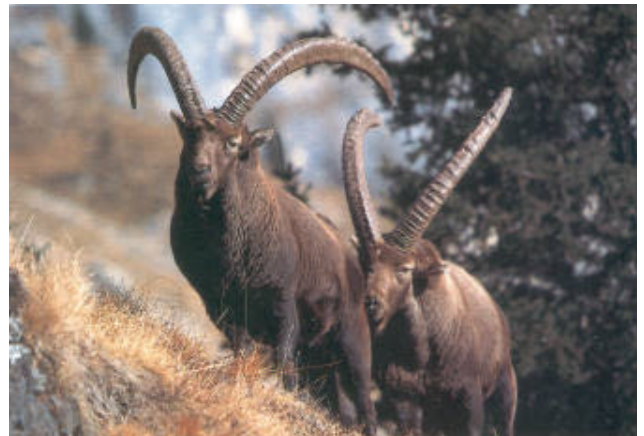
Stambecchi al pascolo. A differenza dei maschi, le femmine hanno una corporatura più leggera oltre che corna meno sviluppate. Tendono ad isolarsi sui pendii più ripidi per accudire la loro prole a quote maggiori di quelle scelte dai maschi.

La civetta nana nidifica nelle cavità lasciate libere dai picchi. Qui è molto frequente il picchio nero, e come gli altri rapaci in cavità naturali degli alberi. Al limite degli alpeggi, ovvero nel piano subalpino fra i 2000 ed i 2300 metri, compare una vegetazione composta per lo più dal larice, dal pino uncinato e dal pino cembro. Il terreno in molte zone più ripido e più difficilmente raggiungibile, rende impossibile lo sfruttamento da parte dell'uomo del bosco e del pascolo ed in quelle aree il bosco si presenta più fitto. Qui troviamo la salamandra nera che si riscalda sulle rocce dei freschi torrentelli, il fagiano di monte, specie molto delicata e protetta che nei mesi di maggio, giugno e luglio nidifica proprio all'ombra di questi ambienti e la nocciolaia la cui alimentazione passa dagli insetti alle lumache e alle bacche.