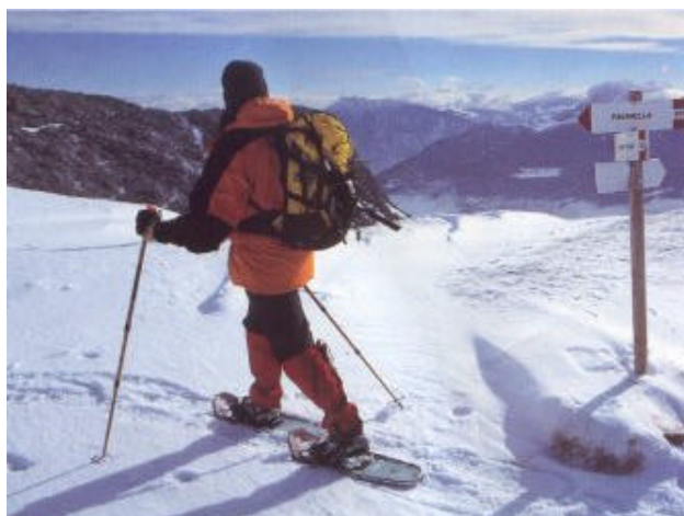
Sul primo itinerario, verso la panoramica Cima di Canfedin

sud porta verso i Prati di Gazza. Piegando progressivamente a sinistra si esce in breve dalla vegetazione ed in terreno aperto si prosegue a sud est su terreno facile, ampio e ondulato, fino al Dos Negro (2000m). Proseguendo ed oltrepassando un grumo di baite solitarie si lascia a destra il Passo S.Giacomo a 1944 metri ed in breve si raggiungono i 2034 metri della panoramica cima di