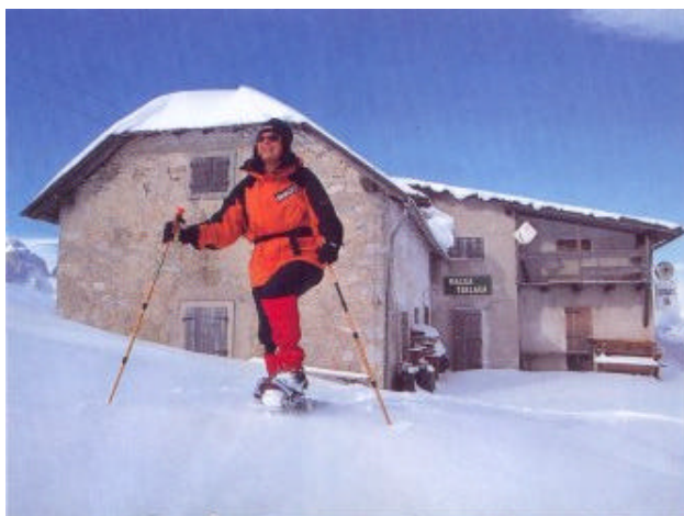
In cammino alla malga di Terlago

Oggi le racchette da neve stanno vivendo una seconda giovinezza, il mercato si sta risvegliando grazie alle nuove tecnologie che si applicano per la loro costruzione e per il crescente desiderio che si sta diffondendo sempre più tra la gente di ogni età di avere un contatto diretto con la natura, di vivere da protagonisti il proprio tempo libero anche in inverno. E allora cosa c'è di meglio di un paio di racchette da neve? Sono facili da usare e permettono di raggiungere luoghi favolosi che rimarrebbero altrimenti inaccessibili a chi non sa sciare ed ha deciso di riscoprire la natura d'inverno con uno zaino sulle spalle, qualche amico, prudenza ed un po' di sentimento.