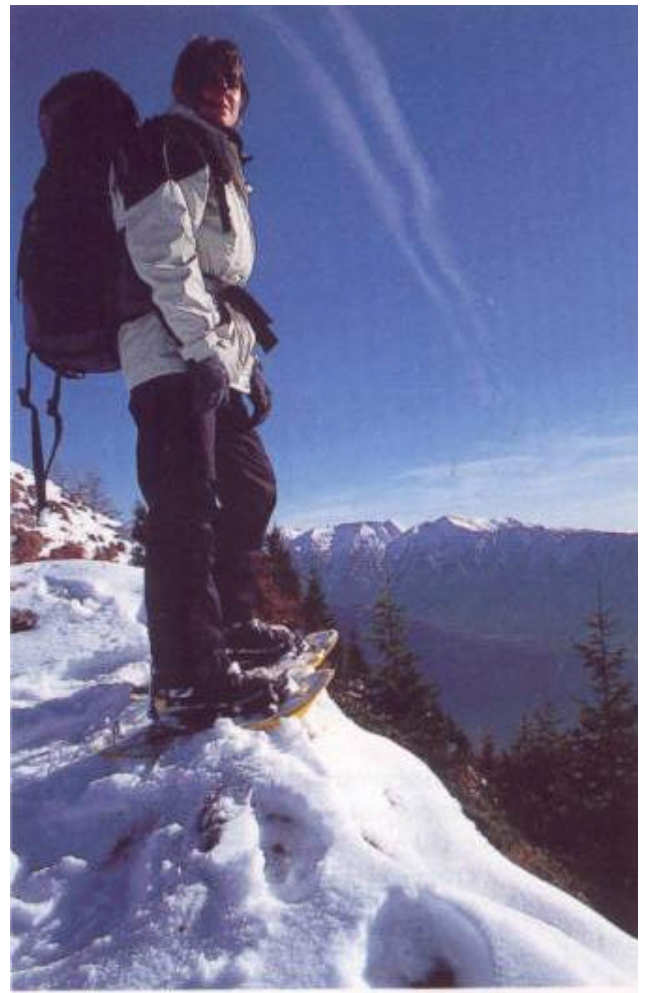
Scorcio sulla Valsugana dall'area cresta della Panarotta

Inoltre in questa zona passano due importanti "vie" per gli escursionisti: il Sentiero Europeo E5 della Federazione Italiana Escursionismo (FIE) e il Sentiero della Pace. La facilità degli accessi e dei percorsi, abbinata alla bellezza dei paesaggi e dell'ambiente di alta montagna in contrasto con i campi coltivati del fondovalle, consente a chiunque di vivere con poco sforzo una vera avventura.