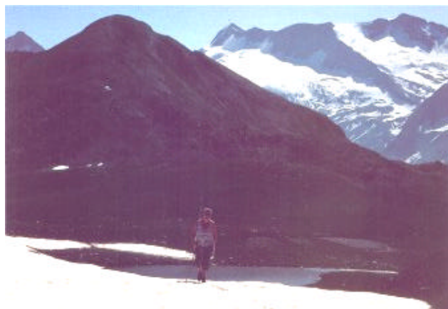
In direzione dello Spitzhorli. Sullo sfondo il gruppo del Monte Leone