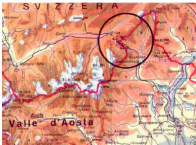
Cartina tratta dall'atlante Marietti. Nel cerchio è evidenziato il Passo del Sempione

Uno dei cantoni più importanti sia per l'alpinismo che per l'escursionismo è proprio il Vallese; Cantone della confederazione con capoluogo Sion, comprende tutto l'alto bacino del Rodano, dalla sua sorgente fino al suo sbocco nel lago di Ginevra. Il Vallese è quindi un