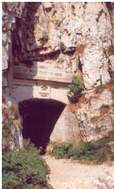
L'accesso alla prima galleria della strada militare realizzata dalla I a Armata Italiana nel 1917

La strada scende ora, prima leggermente, poi con accentuata pendenza sui fianchi della cima dell'Osservatorio e con un'ultima serie di gallerie (attenzione a possibili scivolate) sbuca