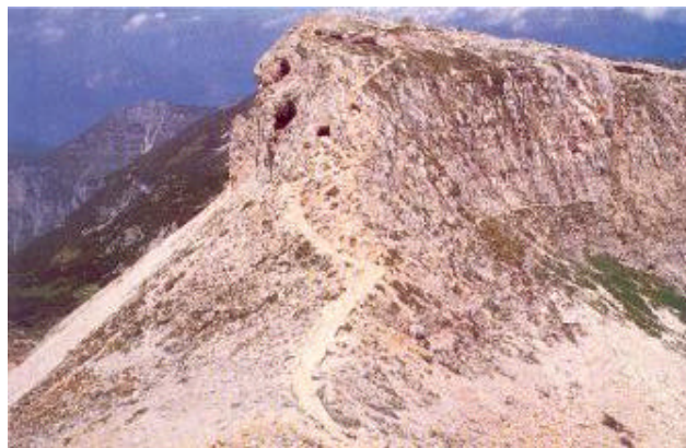
Sul Sentiero Tricolore. Il Dente austriaco visto dal Dente italiano

di eccezionale interesse, ma riservata a escursionisti dotati di esperienza alpinistica e di adeguata attrezzatura (cordino per auto assicurazione e moschettoni) è offerta dal Sentiero Attrezzato G. Faicipieri o delle Cinque Cime che collega le Porte del Pasubio alla Bocchetta di Campiglia traversando in cresta la Cima dell'Osservatorio, il Cimon di Soglio Rosso, il Monte Forni Alti, la Cima Cuaro, la Bella Laita.