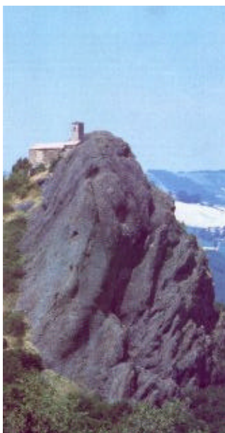
L'Eremo di Perduca dalla Frazione Monta

Giunti alle case di Donceto si scende seguendo la strada asfaltata e, traversata la stretta passerella sul Trebbia, si giunge a Perino (ore 2,15).