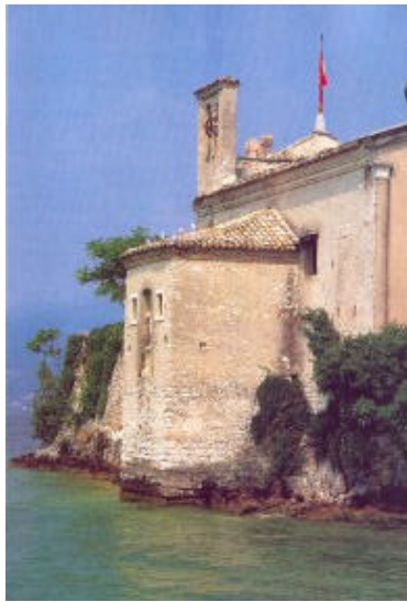
La romantica chiesetta di S. Vigilio che si raggiunge dalla piazza del porto di Garda

Il ritorno avviene sul percorso di andata fino a giungere alla fine del tratto asfaltato, dove in prossimità di località Le Sorte troviamo un crocicchio di stradelle; abbandoniamo la principale e seguiamo quella sassosa che si stacca subito a sinistra in salita e che seguiamo sempre in linea retta, non curandoci delle diramazioni fino a trovarci sulla vetta di Monte Luppia. Proseguiamo fino ad incrociare un sentiero costeggiato da cipressi che prendiamo a destra e seguiamo, con la dovuta attenzione, vicino alle cenge a strapiombo con stupendi panorami su tutto il basso lago. In quest'area si possono notare altre incisioni, anche se meno evidenti. Proseguendo ci si inoltra nuovamente nella lecceta ed è necessario fare attenzione ai segni rosso-azzurri sul terreno per trovare il sentiero migliore per la discesa al grande carpino incontrato all'andata. Anche sbagliando qualche imbocco non ci si perde, poiché l'area è molto piccola; si cerchi comunque di mantenersi sulla sinistra, verso sud-ovest.