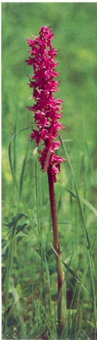
Una bella orchidea, fotografata in cima al M.te Loppia

Scendiamo lungo il percorso dell'andata, riprendiamo la strada bianca e la seguiamo fino a chiudere il nostro viaggio nella piazza di Rivoli.