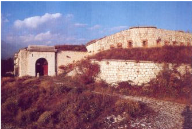
Forte S.Marco, alle spalle di Rivoli, si allunga su di una cengia

Anche Napoleone lasciò traccia del suo passaggio. Da vedere in paese: Corte Bramante, la croce in pietra (1760) presso i giardini e un po' più avanti sulla strada, una bella rappresentazione scultorea della Madonna della Corona.