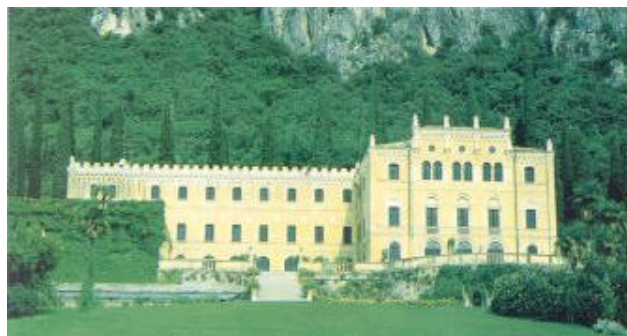
La bella ed imponente villa di Canossa nei pressi di Garda

Teniamo il sentiero sulla destra e seguendo sempre i segni rosso-gialli, saliamo leggermente verso ovest fino ad uscire, dopo una mezz'oretta, sulla strada asfaltata che entra alle spalle di S.Zeno.