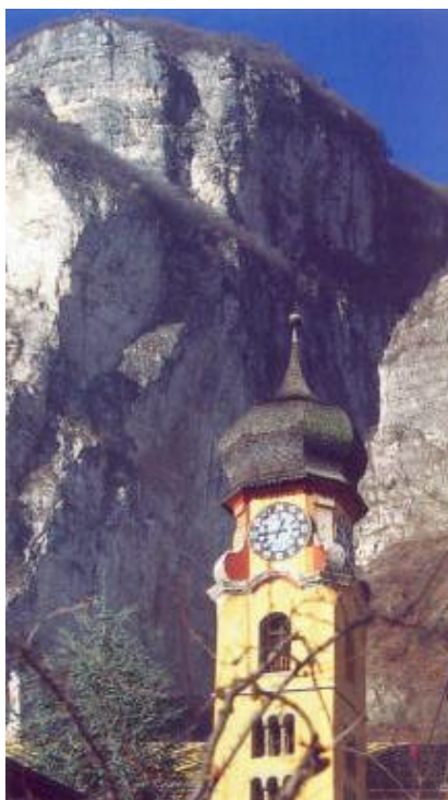
Il Campanile di Mezzocorona ed il Monte omonimo

Salita: dal parcheggio della Pizzeria Ristorante di Cadino si attraversa la strada per imboccare un sentierino (cartello indicatore) che sale nella boscaglia abbastan-