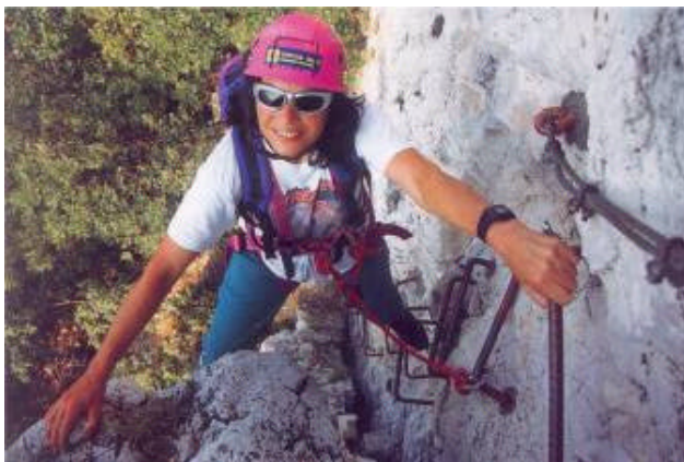
Divertente diedro attrezzato lungo la ferrata di Favogna

Difficoltà: un po' faticoso per i non allenati, ma ben attrezzato nei punti esposti; si adatta anche a neofiti purché accompagnati da esperti