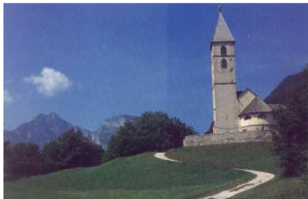
La chiesetta di Favogna

Il sentiero attrezzato del burrone di Mezzocorona è veramente qualcosa di unico nel suo genere, lo stupore, le continue esclamazioni di sorpresa dei miei amici, ormai completamente presi dall'emozionante percorso, ne sono una conferma. L'itinerario con l'aiuto di qualche fune, pioli e scale metalliche, dopo aver vinto una breve, esposta ma facile balza rocciosa si incanala nel cuore di una forra oscura: un paesaggio dantesco, infernale, che alla fine tra un'infinità di giochi di colori e bizzarrie naturali ci porterà in tre ore di continuo susseguirsi di fortissime visioni alla dolcezza paradisiaca del "Monte".