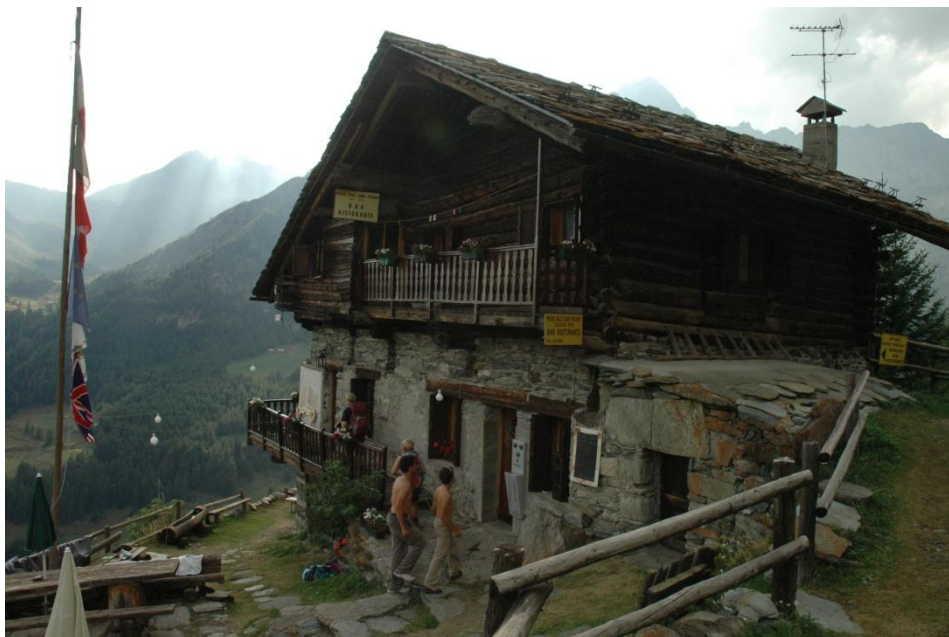
Rifugio Frachey quota 2060 m N45 51.945 E7 44.371

Il sentiero entra in salita nel bosco ed in circa 45 minuti arriviamo ai rifugi di cui sopra poco distanti l’uno dall’altro, essi fanno parte di un villaggio Walser (popolazione di origine germanica che emigrò verso queste aree verso il XIII secolo le cui abitazioni hanno i caratteristici basamenti fatti a fungo per evitare che i roditori penetrassero all’interno); il Rifugio G.Ferraro offre una cucina deliziosa ed è spesso meta di turisti-trekker dal palato raffinato !