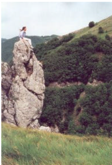
Bizzarrie della natura

La Lorda, il Vallone dell'Inferno, il torrente Callora, la Rava delle Coppelle sono piccoli corsi d'acqua, taluni a carattere stagionale, che alla bellezza dei luoghi uniscono valori naturalistici di notevole importanza per la varietà della flora e degli aspetti geologici.