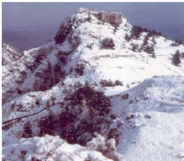
I resti del castello medievale che domina Roccamandolfi

tenuto in nessuna considerazione un ambiente di rara bellezza rovinato da una semplice discarica altrove posizionabile.