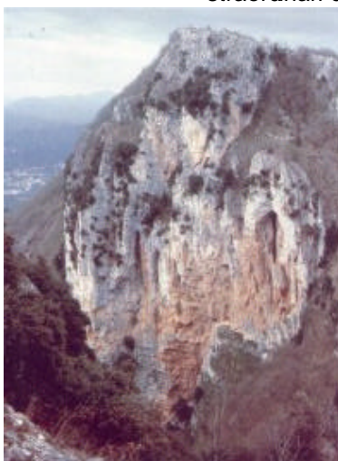
Pendici di "Peschio Rosso"

Il percorso, che nel tratto iniziale si svolge tranquillamente su un soffice tappeto di muschio, perde queste caratteristiche rapidamente: inizia la serie di cascate e di scivoli che proseguono sino a dopo Peschio Rosso. Le pareti ripide non lasciano possibilità di superare questi ostacoli e molto spesso bisogna ritornare sui propri passi per trovare un percorso che conduca alla base della