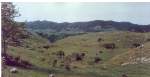
Sulò pianoro in primavera

cascata. Qualche volta è necessario l'uso di corde e discensori che permettono di scendere senza essere costretti a continue risalite lungo i versanti.