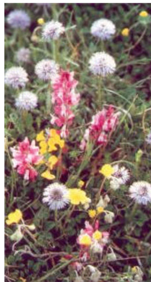
Esempi di flora

Peschio Rosso si presenta come un monolite calcareo a cui gli agenti atmosferici hanno arrotondato le forme creando incavi e rientranze che potrebbero celare alla base qualche traccia di frequentazione remota.